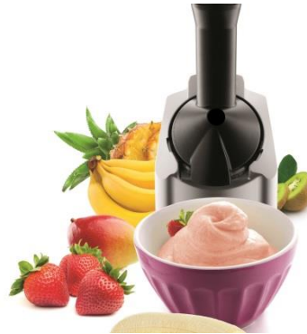
Frozen Fruit Maker