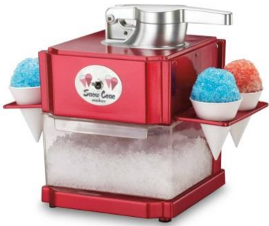
Máquina de Granizados