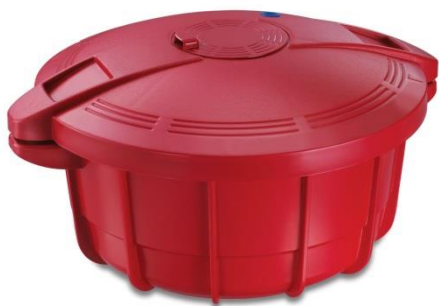
Olla a Presión para Microondas