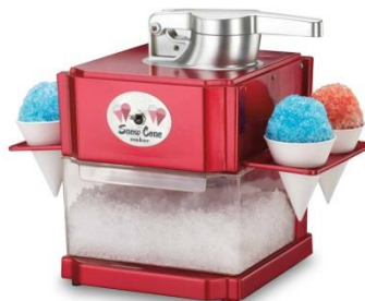
Máquina de Granizados